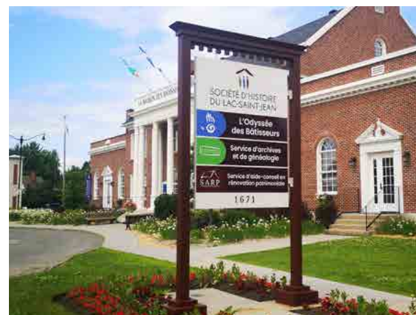
L'enseigne extérieure a dû être refaite en raison de sa vétusté. Le nouveau visuel est conforme à la charte graphique de la SHL.