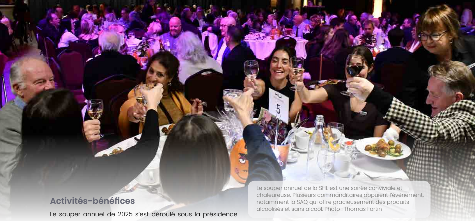
Le souper annuel de la SHL est une soirée conviviale et chaleureuse. Plusieurs commanditaires appuient l'évènement, notamment la SAQ qui offre gracieusement des produits alcoolisés et sans alcool.