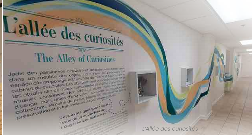
L'Allée des curiosités ↑

← Élise Prescott catalogue et documente les artefacts de la collection muséale. Le poncho scout qu'elle tient comporte 87 écussons, 25 épinglettes et 7 bandeaux : ses symboles reflètent l'histoire unique de son propriétaire.