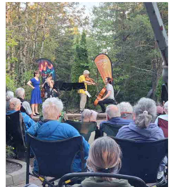
Concert du Quatuor Saguenay sur le Parcours des Bâtitseurs

La SHL a aussi contribué à la réalisation du nouveau parc Sainte-Marie, grâce à une commandite de Rio Tinto.