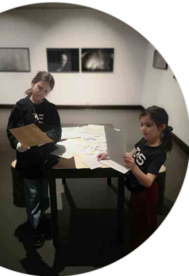
↑ Plongez dans l'histoire du Grand Feu, Activité proposée de la maternelle au secondaire à travers l'exposition des artistes Nicolas Lévesque et Sophie Gagnon-Bergeron.