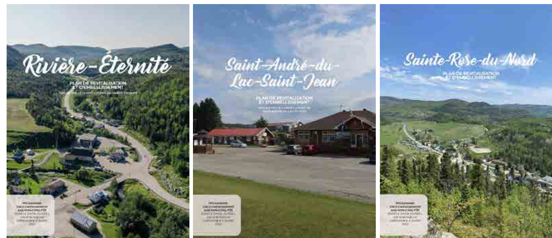
Pages couvertures des plans de revitalisation réalisés pour les municipalités de Rivière-Éternité, Saint-André-du-Lac-Saint-Jean et Sainte-Rose-du-Nord