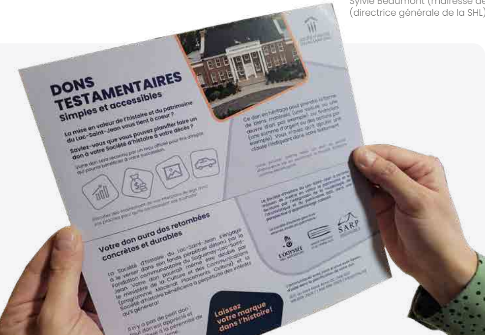
Un carton visant à promouvoir les dons testamentaires (dons en héritage) a été produit.