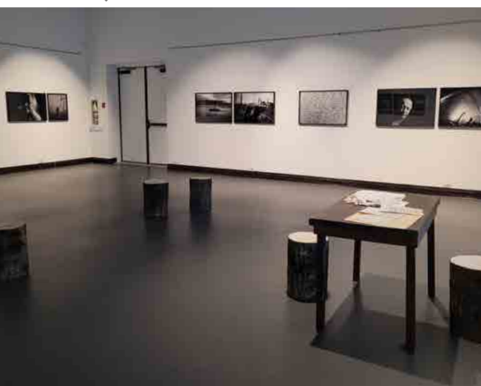
Exposition Grand Feu