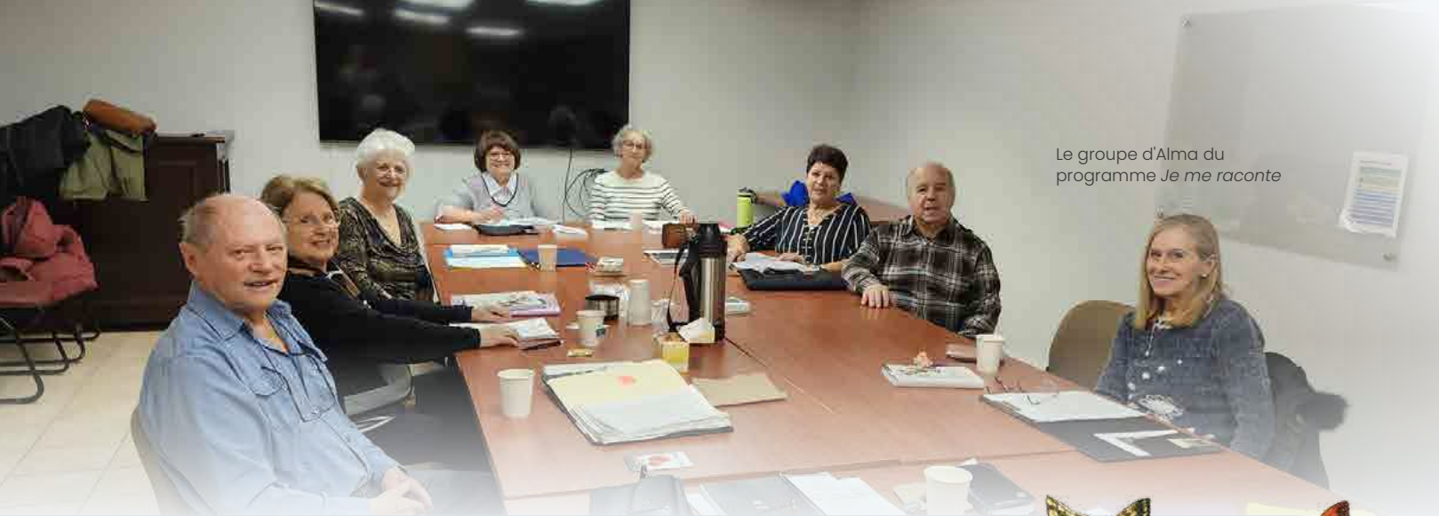
Le groupe d'Alma du programme Je me raconte