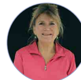
Dominique Poirat Architecte