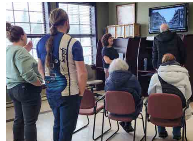
Temps des sucres