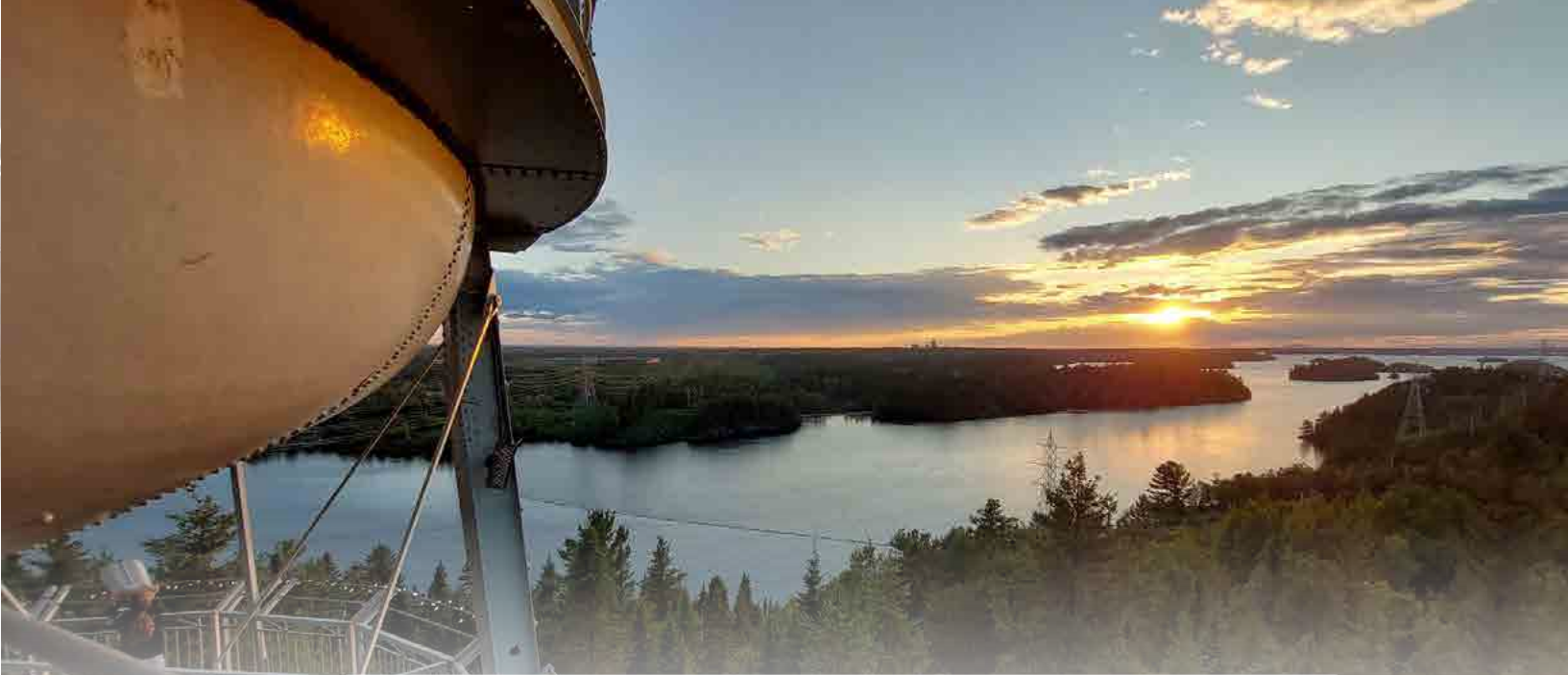
Balade au crépuscule