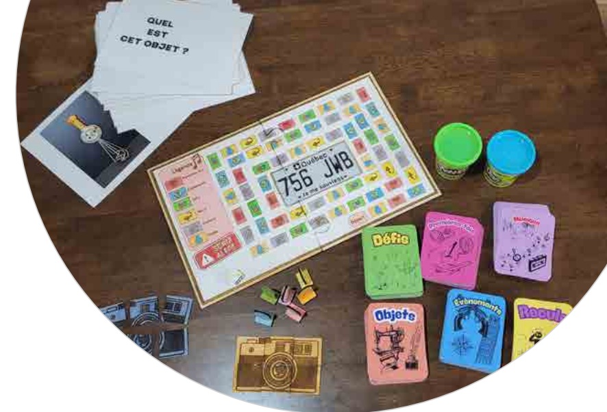
↑ Jeu de société conçu en collaboration avec les élèves de 4 e secondaire de l'école Camille-Lavoie

Il s'agit d'une offre d'activités ludiques intérieures et extérieures pour célébrer l'arrivée de l'été et la fin des classes.