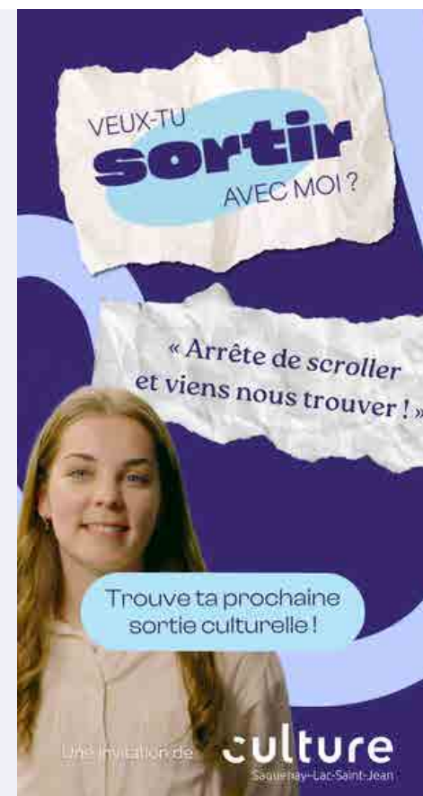
Campagne publicitaire pour Culture Saguenay-Lac-Saint-Jean