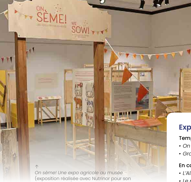
↑ On sème! Une expo agricole au musée (exposition réalisée avec Nutrinor pour son 75 e anniversaire)