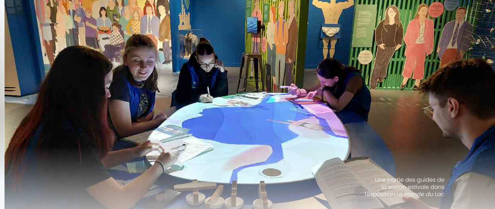
Une partie des guides de la saison estivale dans l'exposition Le monde du Lac