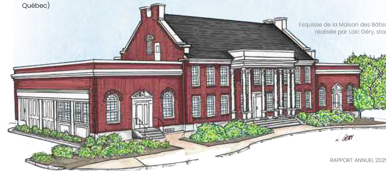
Esquisse de la Maison des Bâisseurs, réalisée par Loïc Géry, stagiaire