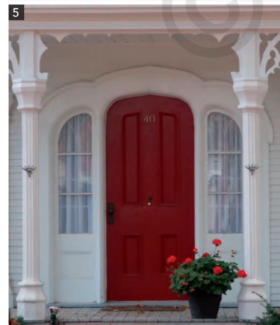
5 Porte en arc avec baies latérales