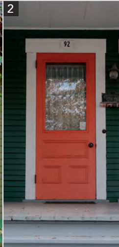
2 Porte avec caissons moulurés