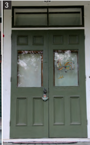
3 Porte double avec imposte vitrée