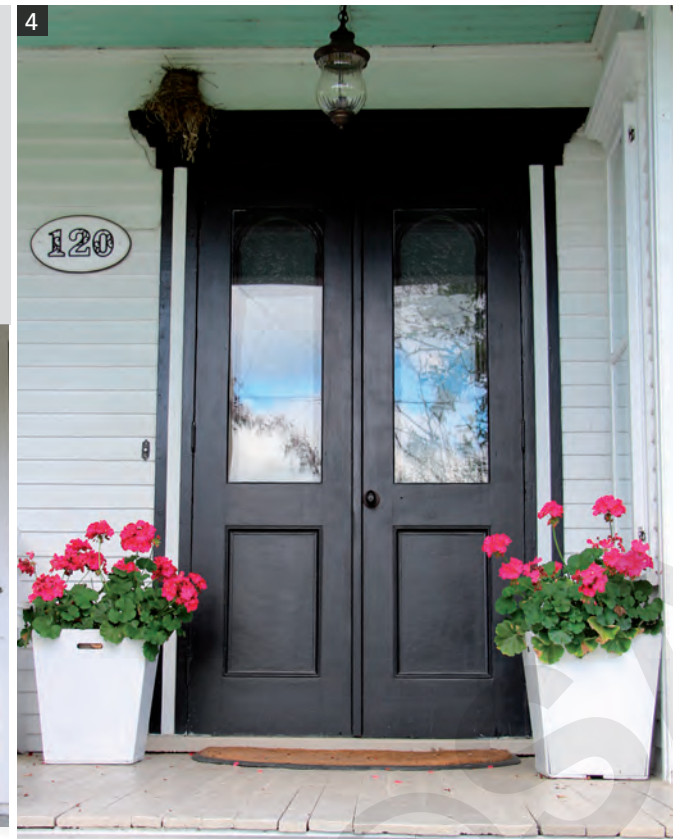
4 Porte double en bois avec caissons moulurés