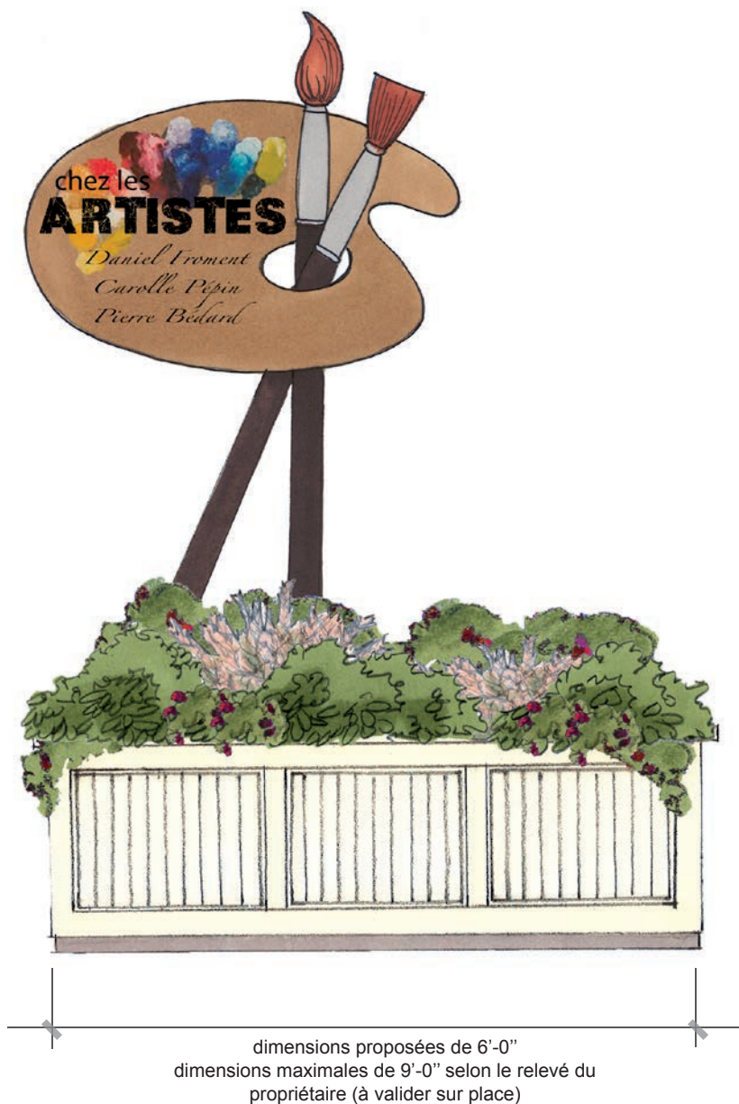
dimensions proposées de 6'-0" dimensions maximales de 9'-0" selon le relevé du propriétaire (à valider sur place)