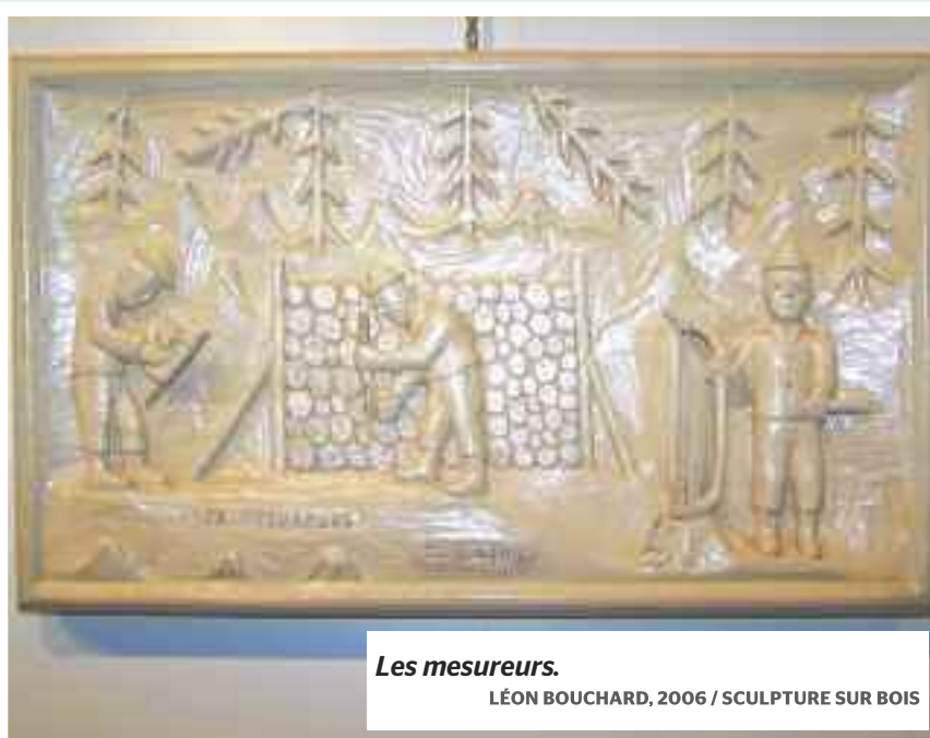
Les mesureurs. LÉON BOUCHARD, 2006 / SCULPTURE SUR BOIS

1970 Premières fouilles archéologiques régionales, près de l'échangeur du pont Dubuc, à Chicoutimi, lieu de l'ancien poste de traite.