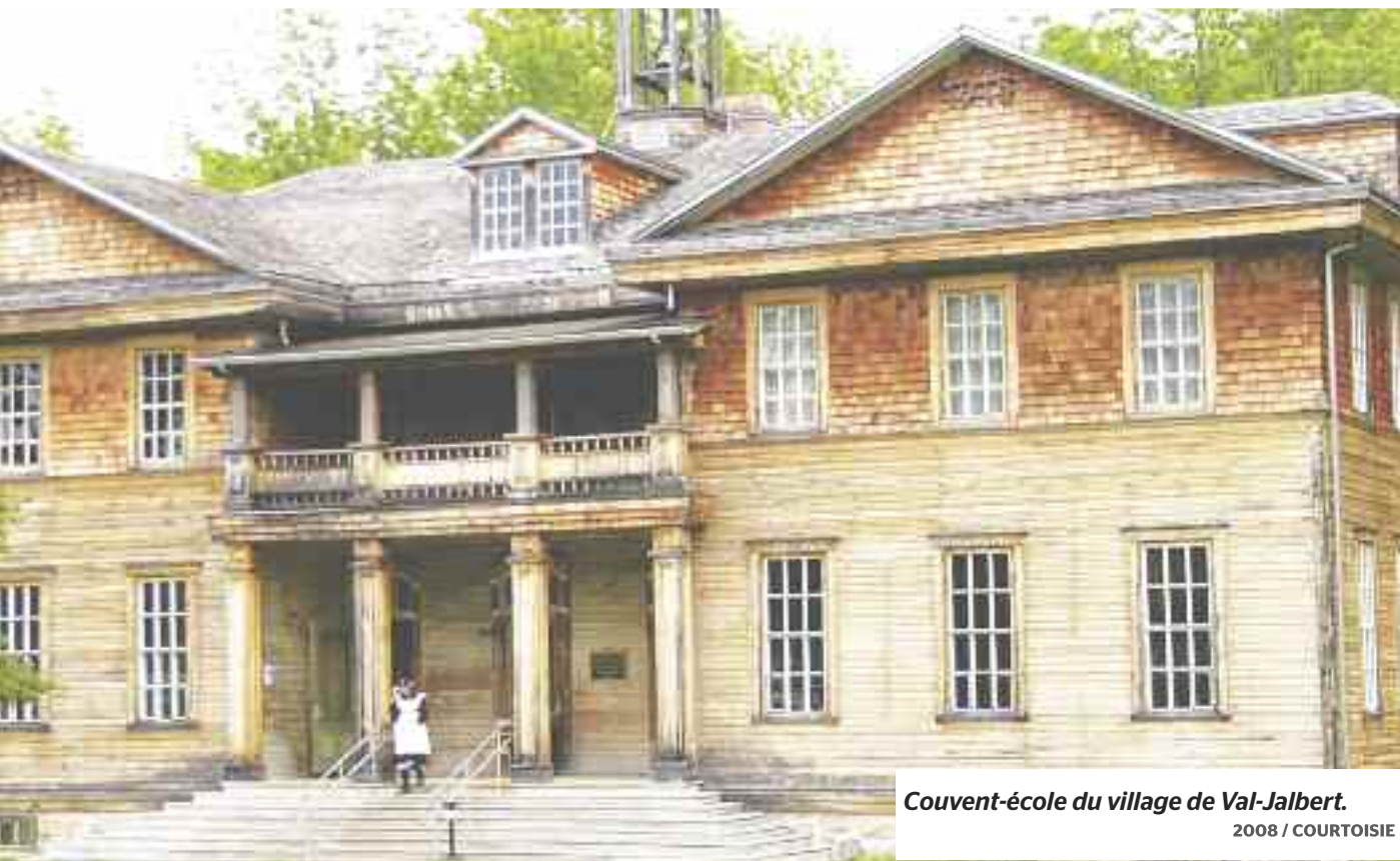
Couvent-école du village de Val-Jalbert. 2008