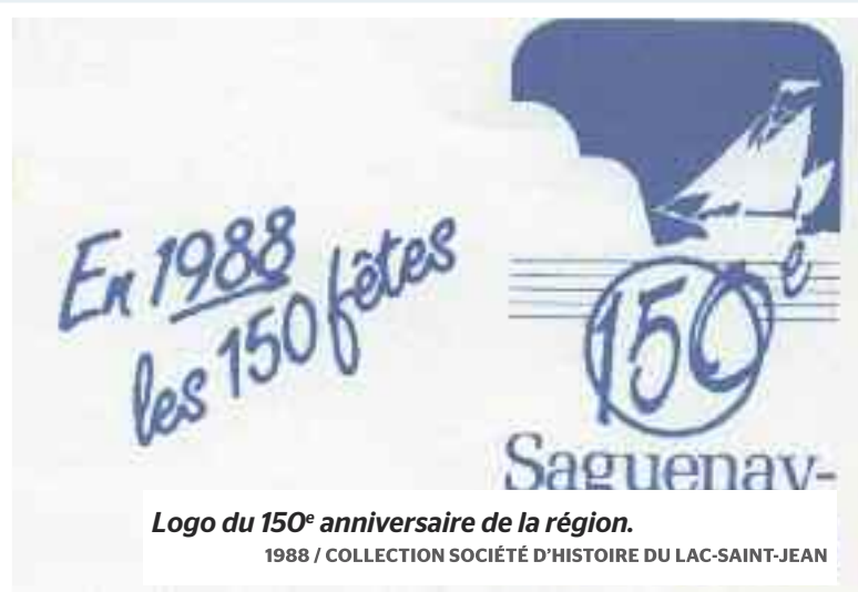
Logo du 150 e anniversaire de la région.

1988