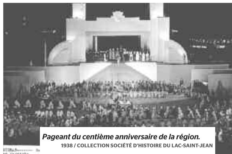
Pageant du centième anniversaire de la région.